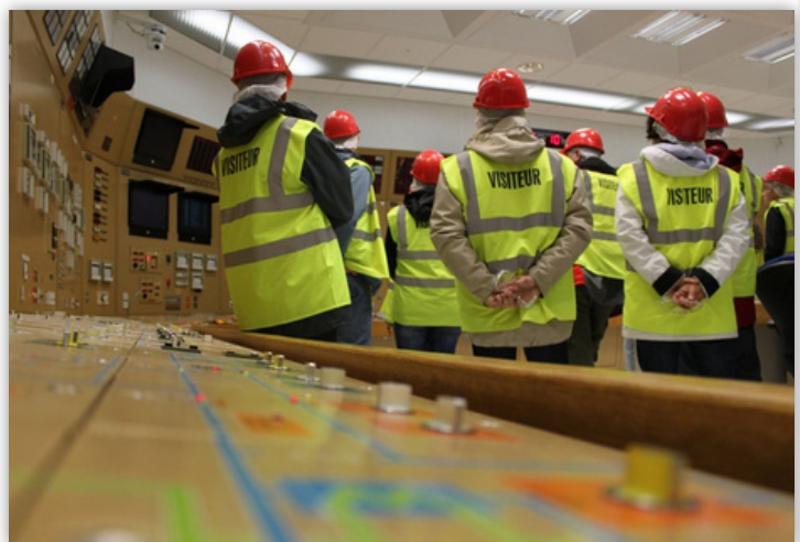
Centrale nucléaire de Flamanville