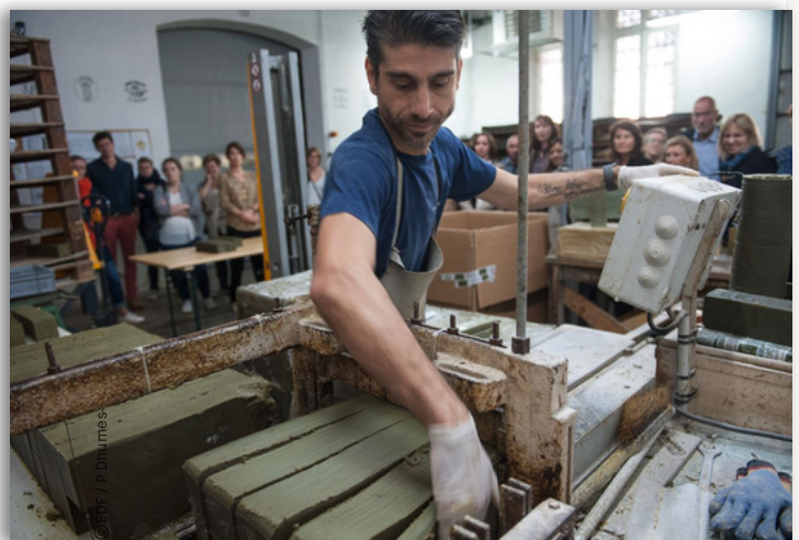
Savonnerie Marius Fabre