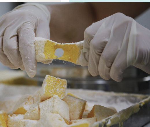
La Fabrique de Julien

Fabrice Pannekoucke, Président d'Auvergne-Rhône-Alpes Tourisme.