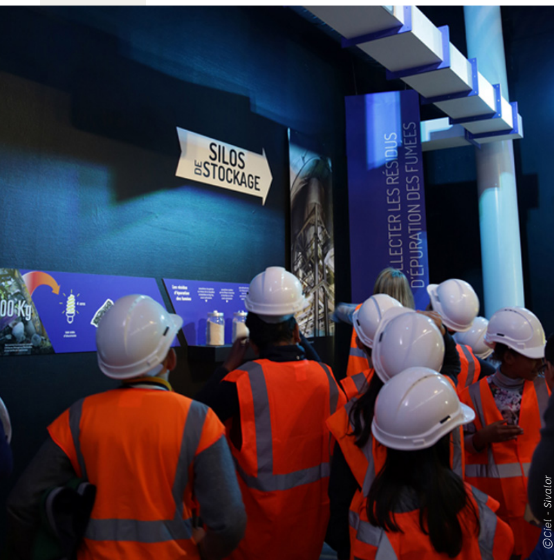
Ciel - Sivalor

La Chambre Syndicale de la Métallurgie de Haute-Savoie déploie depuis 2022 "Indus'Tour", un événement regroupant une cinquantaine d'industriels à destination des scolaires sur des enjeux d'orientation ou d'insertion professionnelle.